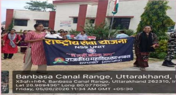
Banbasa Canal Range, Uttarakhand, India X3qh+h64, Banbasa Canal Range, Uttarakhand 262310, India Lat 28.989436° Long 80.077606° Friday, 05/06/2026 11:34 AM GMT +05:30