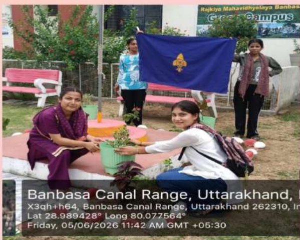
Banbasa Canal Range, Uttarakhand, India X3qh+h64, Banbasa Canal Range, Uttarakhand 262310, India Lat 28.989428° Long 80.077564° Friday, 05/06/2026 11:42 AM GMT +05:30