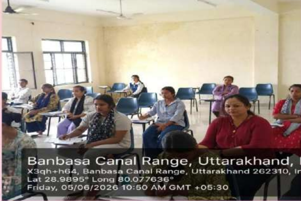
Banbasa Canal Range, Uttarakhand, India X3qh+h64, Banbasa Canal Range, Uttarakhand 262310, India Lat 28.9895° Long 80.077636° Friday, 05/06/2026 10:50 AM GMT +05:30