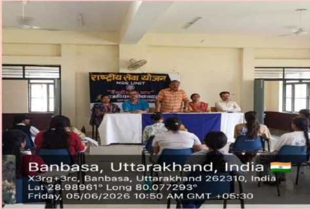
Banbasa, Uttarakhand, India X3rg+h3rc, Banbasa, Uttarakhand 262310, India Lat 28.98961° Long 80.077293° Friday, 05/06/2026 10:50 AM GMT +05:30