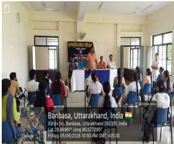
Banbasa, Uttarakhand, India X3rg+3rc, Banbasa, Uttarakhand 262310, India Lat 28.98961° Long 80.077295° Friday, 05/06/2026 10:50 AM GMT +05:30