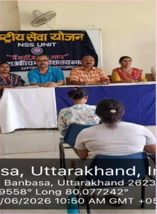
Banbasa, Uttarakhand, India Banbasa, Uttarakhand 262310, India Lat 28.98958° Long 80.077242° Friday, 05/06/2026 10:50 AM GMT +05:30