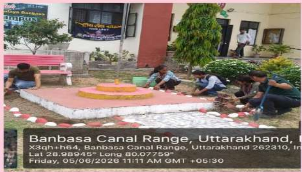
Banbasa Canal Range, Uttarakhand, X3qh+h64, Banbasa Canal Range, Uttarakhand 262310, In Lat 28.98945° Long 80.07759° Friday, 05/06/2026 11:11 AM GMT +05:30