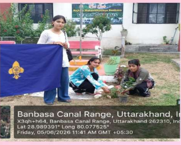
Banbasa Canal Range, Uttarakhand, India X3qh+h64, Banbasa Canal Range, Uttarakhand 262310, India Lat 28.989391° Long 80.077525° Friday, 05/06/2026 11:41 AM GMT +05:30