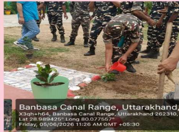
Banbasa Canal Range, Uttarakhand, X3qh+h64, Banbasa Canal Range, Uttarakhand 262310, In Lat 28.989425° Long 80.077557° Friday, 05/06/2026 11:26 AM GMT +05:30