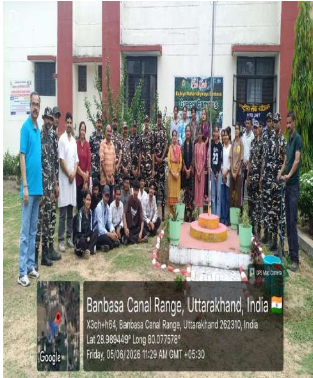
Banbasa Canal Range, Uttarakhand, India X3qh+h64, Banbasa Canal Range, Uttarakhand 262310, India Lat 28.989443° Long 80.077578° Friday, 05/06/2026 11:29 AM GMT +05:30