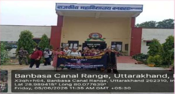
Banbasa Canal Range, Uttarakhand, India X3qh+h64, Banbasa Canal Range, Uttarakhand 262310, India Lat 28.989415° Long 80.077639° Friday, 05/06/2026 11:35 AM GMT +05:30