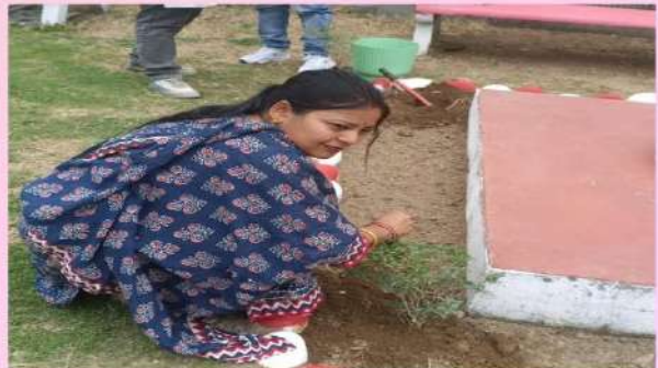
Banbasa Canal Range, Uttarakhand, X3qh+h64, Banbasa Canal Range, Uttarakhand 262310, In Lat 28.989457° Long 80.077596° Friday, 05/06/2026 11:08 AM GMT +05:30