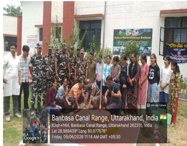
Banbasa Canal Range, Uttarakhand, India X3qh+h64, Banbasa Canal Range, Uttarakhand 262310, India Lat 28.989439° Long 80.077576° Friday, 05/06/2026 11:14 AM GMT +05:30