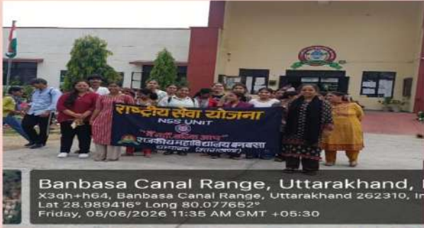
Banbasa Canal Range, Uttarakhand, India X3qh+h64, Banbasa Canal Range, Uttarakhand 262310, India Lat 28.989416° Long 80.077652° Friday, 05/06/2026 11:35 AM GMT +05:30