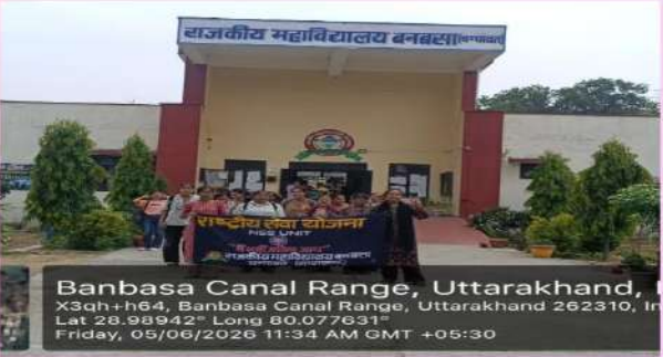
Banbasa Canal Range, Uttarakhand, India X3qh+h64, Banbasa Canal Range, Uttarakhand 262310, India Lat 28.98942° Long 80.077631° Friday, 05/06/2026 11:34 AM GMT +05:30